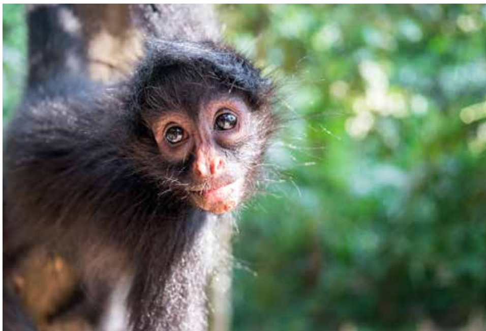
Mono araña (Ateles chamek)

La zafra de castaña requiere que los recolectores se internen en el bosque durante un periodo de aproximadamente tres meses al año. Dada esa situación, la Dirección de la Reserva identificó un impacto negativo en la fauna, ocasionado por la cacería realizada por los recolectores contratados en el periodo de zafra. Ante este problema, el área protegida, en coordinación con el Servicio Nacional de Áreas Protegidas (SERNAP), decidió establecer e implementar un reglamento que regula todas las actividades en torno a la recolección de castaña desde el año 2008 (contratación, número de trabajadores, permisos y prohibiciones, etc.), incluyendo la prohibición de cacería a los recolectores temporales que son contratados en los predios privados de la Reserva.