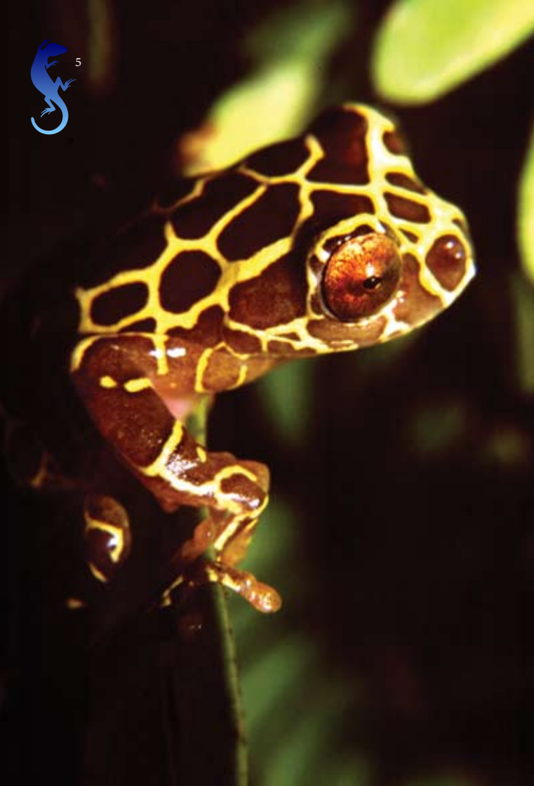
Tree frog in the Mamirauá Reserve, Brazilian Amazon